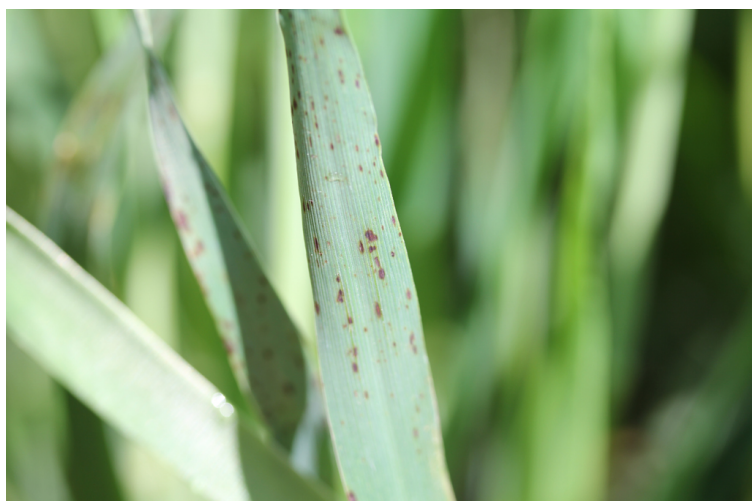
Billede 3. Fysiologiske pletter i vinterbygssorten Matros. Pletterne ses i flere sorter og kan bl.a. adskilles fra Ramularia ved, at den gule zone omkring pletterne mangler. I Matros og andre vinterbygssorter er også set, at meldug-afværge-reaktioner kan give lignende symptomer, men så er det tydeligt evt. med lup at se meldugrester i pletterne.