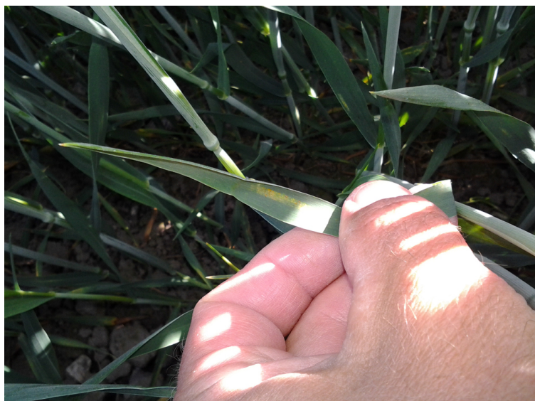
Billede 1. Gulrust i hvedesorten JB Asano ved Ringsted fotograferet 4. juni 2013.