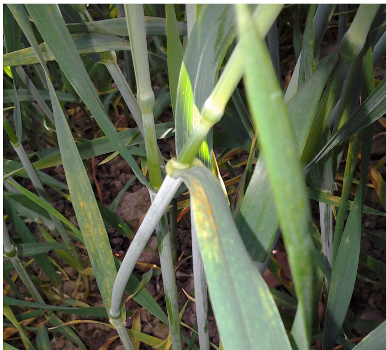
Billede 2. Gulrust i hvedesorten JB Asano ved Ringsted fotograferet 4. juni 2013.